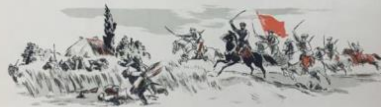
Напомним, чтоб не забывали, Как на ноябрьском холоду Мы прочь штыками выбивали Их в восемнадцатом году.