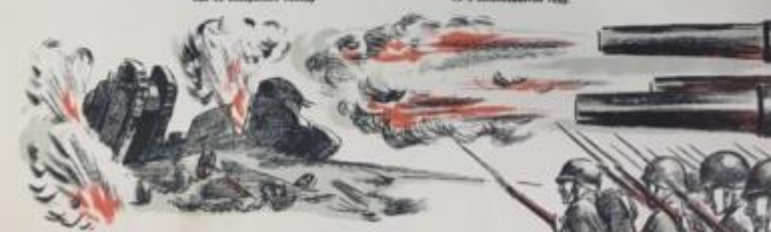
Не забывая, не прощая, Одним движением вперед,- Свою отчизну защищая, Пойдет разгневанный народ.