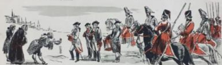
Потом вспомним день паденья Последних орденских знамен, Когда отдавший все владенья Был Русью орден упразднен.