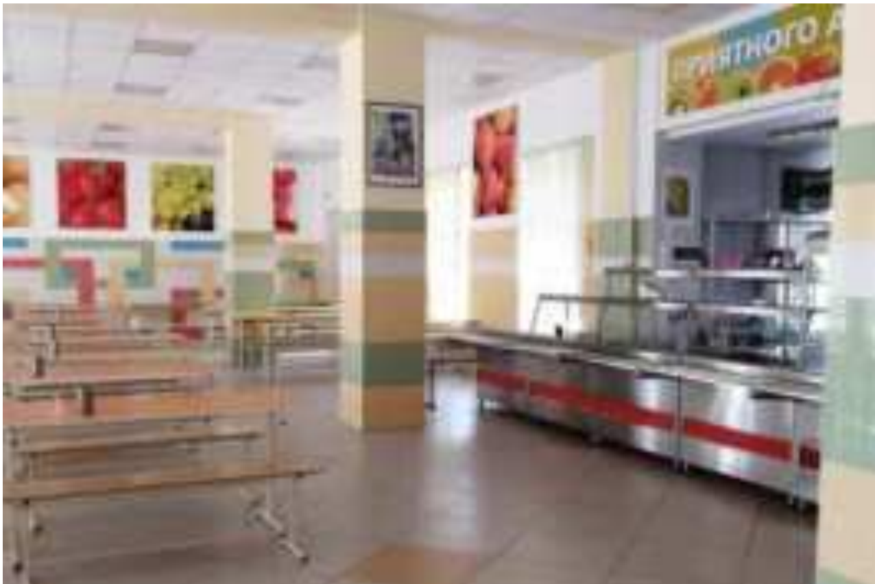
Рис. Организация школьного питания в МО г. Геленджик

Подробнее о проекте пользователи соцсетей смогут узнать из информационных материалов, опубликованных в сообществах Минпросвещения во всех социальных сетях.