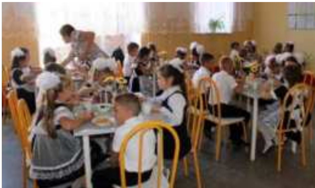
Рис. Организация школьного питания в МО Калининский район

Цель воспитательной работы: сформировать у обучающихся представлений о правильном, здоровом питании.