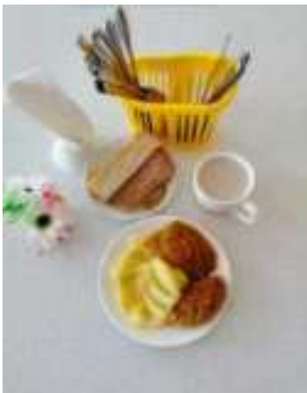
Рис. Вариант завтрака в школе МО Апшеронский район