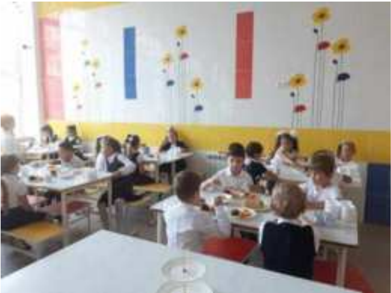
Рис. Школьное питание в МО г. Геленджик

Здоровое питание направлено на снижение рисков формирования патологии желудочно-кишечного тракта, эндокринной системы, снижение риска развития сердечно-сосудистых заболеваний и избыточной массы тела.