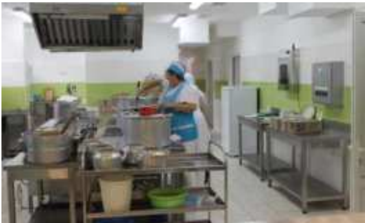
Рис. Школьный пищеблок в МО Кореновский район

Обед должен включать закуску (салат или свежие овощи), горячее первое, второе блюдо и напиток. Обед в зависимости от возраста обучающегося, должен содержать 20-25 г белка, 20-25 г жира и 80-100 г углеводов.