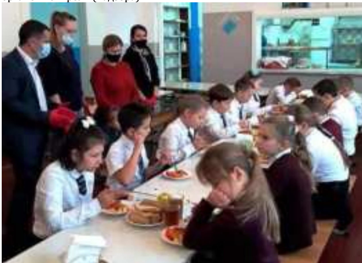
Рис. Контроль качества питания в МБОУ СОШ № 6 х. Танцура Крамаренко МО Тимашевский район

Итоги проверок обсуждаются на общеродительских собраниях и могут явиться основанием для обращений в адрес администрации образовательной организации, ее учредителя и (или) оператора питания, органов контроля (надзора).