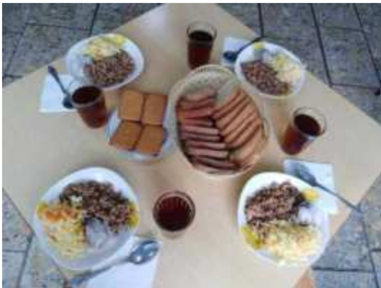
Рис. Вариант сервировки в школьной столовой МО Каневской район