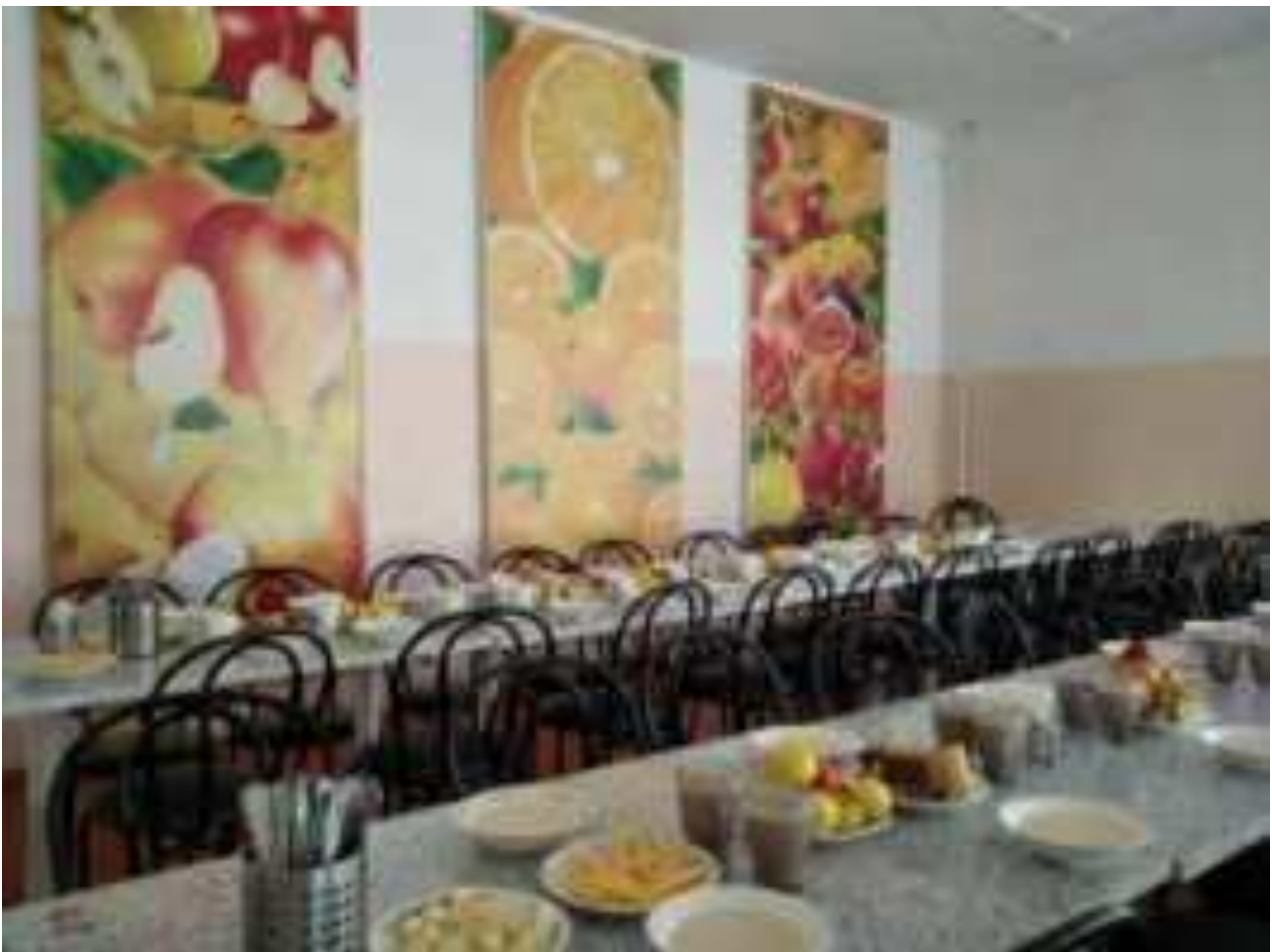
Рис. Школьный завтрак в МАОУ СОШ №1 имени В.И. Фадеева ст. Калининской МО Калининский район

Следует особо подчеркнуть важную роль кисломолочных продуктов (кефира, ряженки, йогуртов, простокваш и т.д.). Эти напитки не только содержат пищевые вещества (белок, Са, витамин В2 и др.), но и несут в себе полезные микроорганизмы, так называемые пробиотики («поддерживающие жизнь»), которые не только нормализуют состав кишечной микрофлоры, подавляя рост болезнетворных микробов, но и стимулирует иммунный ответ организма, повышая его устойчивость к инфекциям.