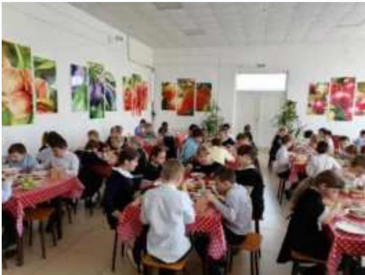
Рис. Питание в МБОУ СОШ №6 имени кавалера ордена Красной Звезды Андрея Леонидовича Доценко пос. Совхозного МО Славянский район

При приеме пищи дети не должны спешить. При быстрой еде пища плохо измельчается, недостаточно обрабатывается слюной, что ведет к повышенной нагрузке на слизистую желудка. В результате ухудшается перевариваемость и усвояемость пищи. Торопливая еда формирует у детей патологический стереотип поведения.