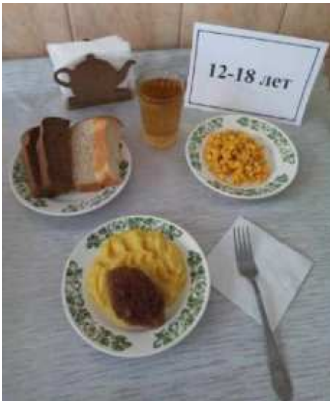
Рис. Питание с учетом возраста в школе МО Кореновский район

представлены в разделе «Общие рекомендации родителям по питанию детей школьного возраста».