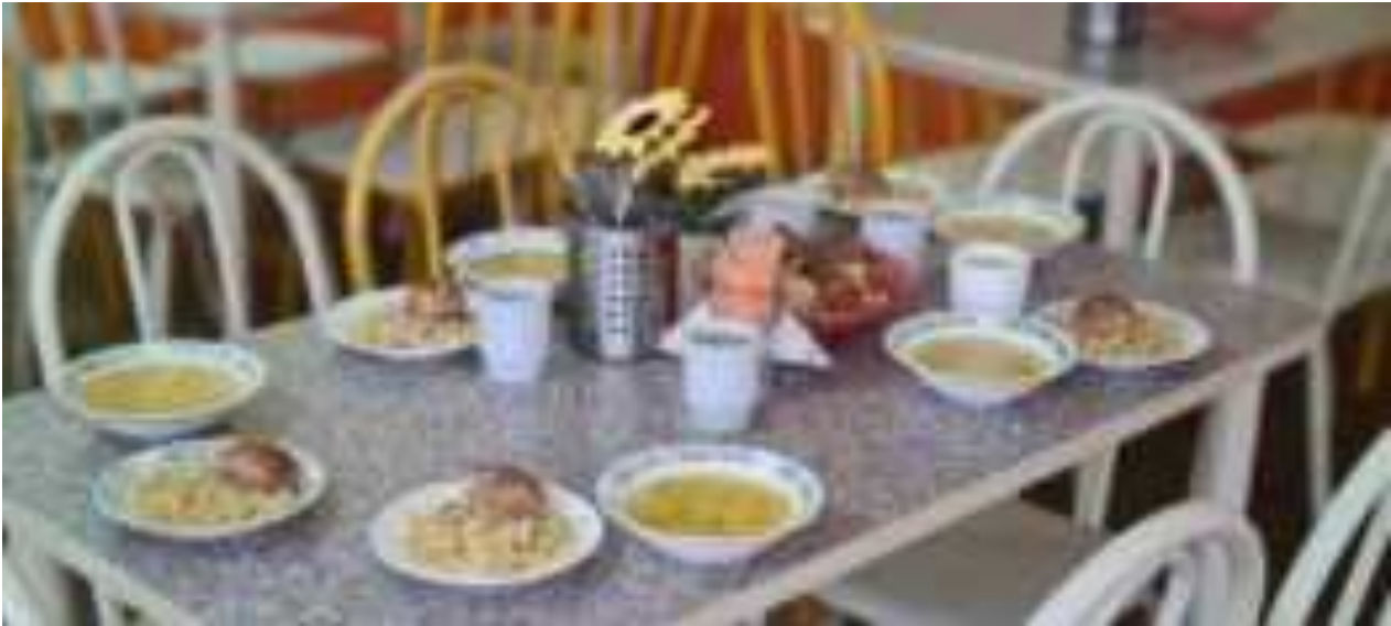
Рис. Школьный обед в МО Калининский район

Углеводы содержатся в хлебе, крупах, картофеле, овощах, ягодах, фруктах, сахаре, сладостях. Избыток в питании хлеба, мучных и крупяных изделий, сладостей приводит к повышенному содержанию в рационе углеводов, что нарушает правильное соотношение между белками, жирами и углеводами.