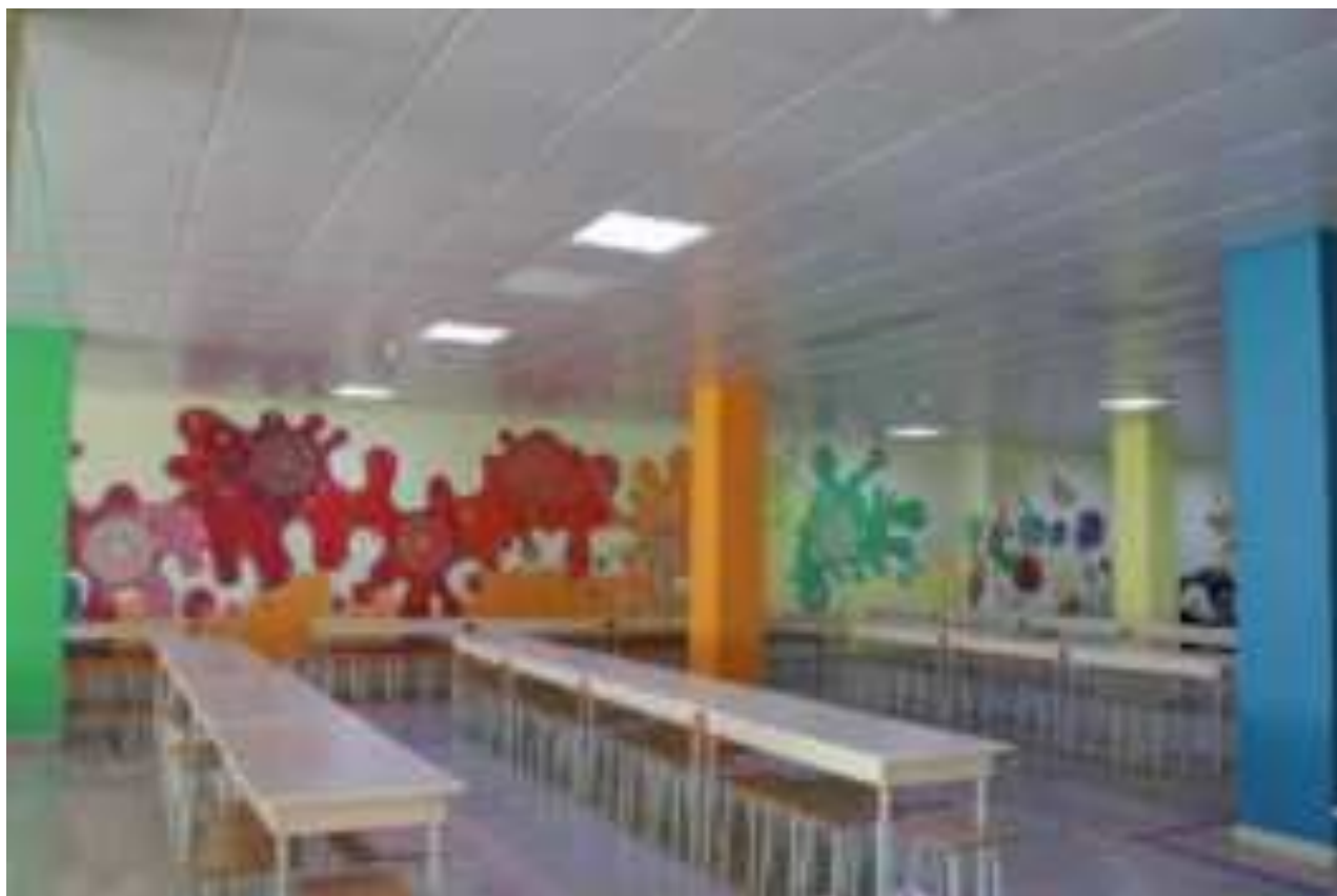
Рис. Оформление обеденной зоны в школе МО г. Новороссийска

В образовательной организации создаются благоприятные условия для приема пищи, включая интерьер обеденного зала, сервировку столов, микроклимат, освещенность.