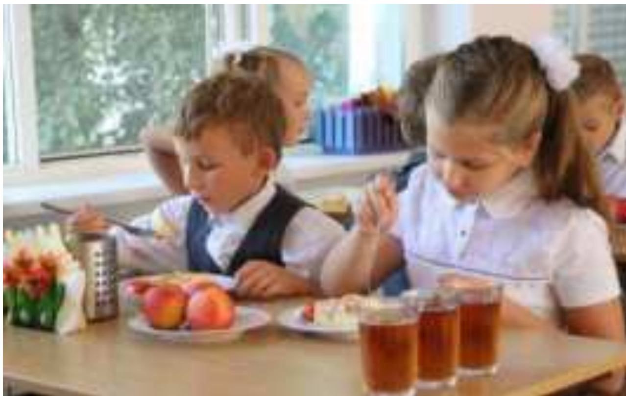
Рис. Школьное питание в МО Тихорецкий район

Главная цель питания - обеспечение роста, развития, работоспособности, хорошего самочувствия, высокой сопротивляемости различным неблагоприятным факторам окружающей среды и инфекциям.