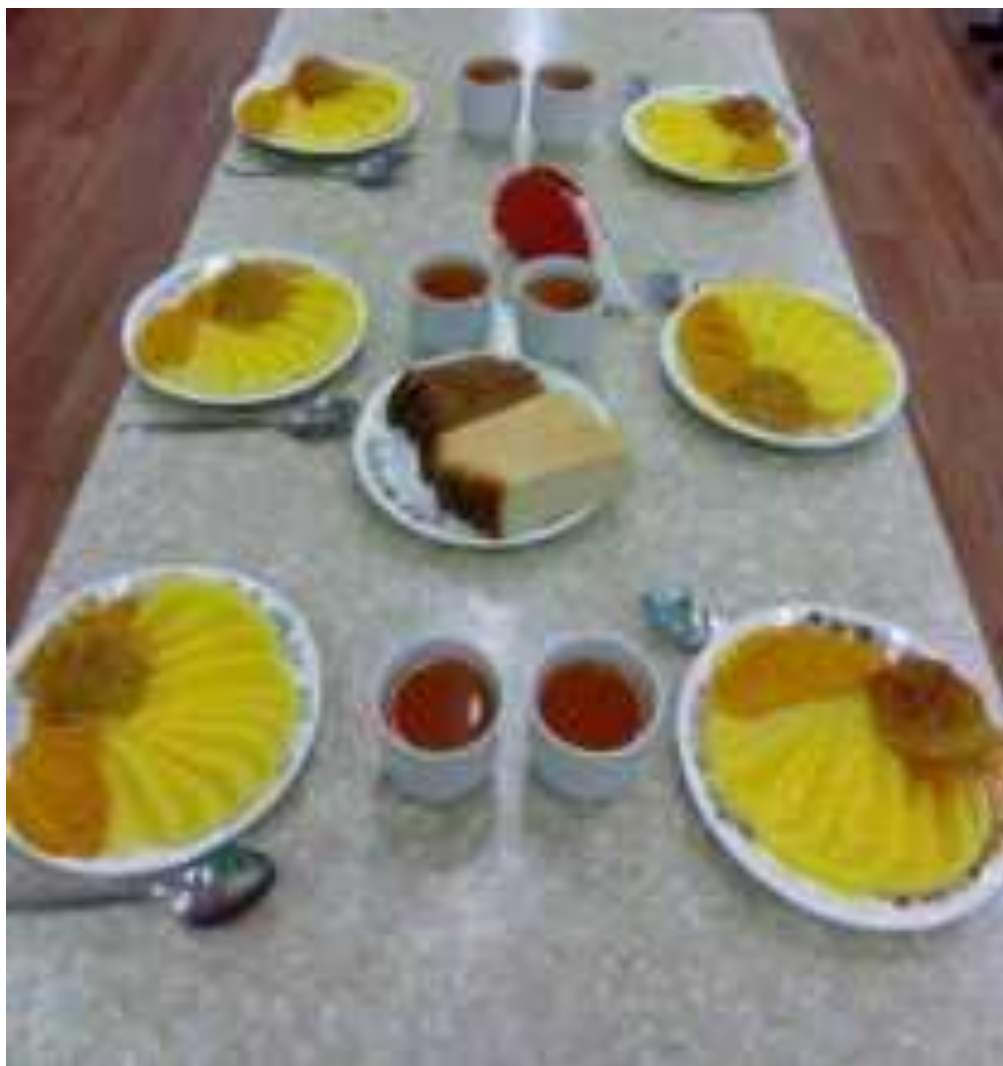
Рис. Сервировка столов в МБОУ СОШ №10 имени выпускника школы Д.С. Целовальника МО Славянский район

Порядок проведения мероприятий по родительскому контролю за организацией питания обучающихся, в том числе регламентирующего порядок доступа законных представителей обучающихся в помещения для приема пищи, рекомендуется регламентировать локальным нормативным актом общеобразовательной организации.