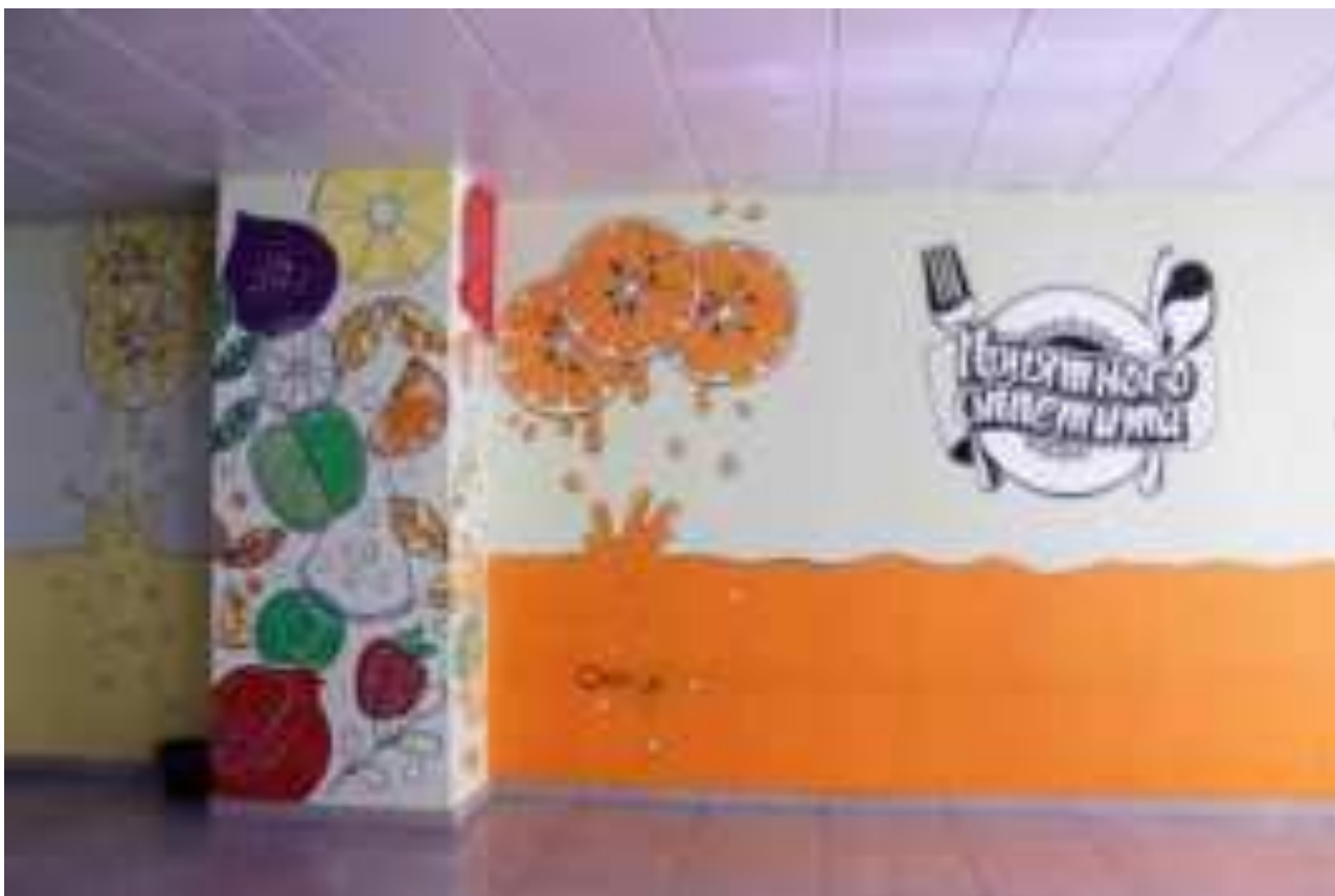
Рис. Оформление школьного обеденного зала в МО г. Новороссийск

Формы работы с родителями: просветительские беседы, тренинги; блоги и форумы класса, школы; вовлечение в текущую образовательную работу по программам для школьников; вовлечение в конкурсную деятельность по вопросам здорового питания совместно с детьми; обучение по просветительским программам «Основы здорового питания».