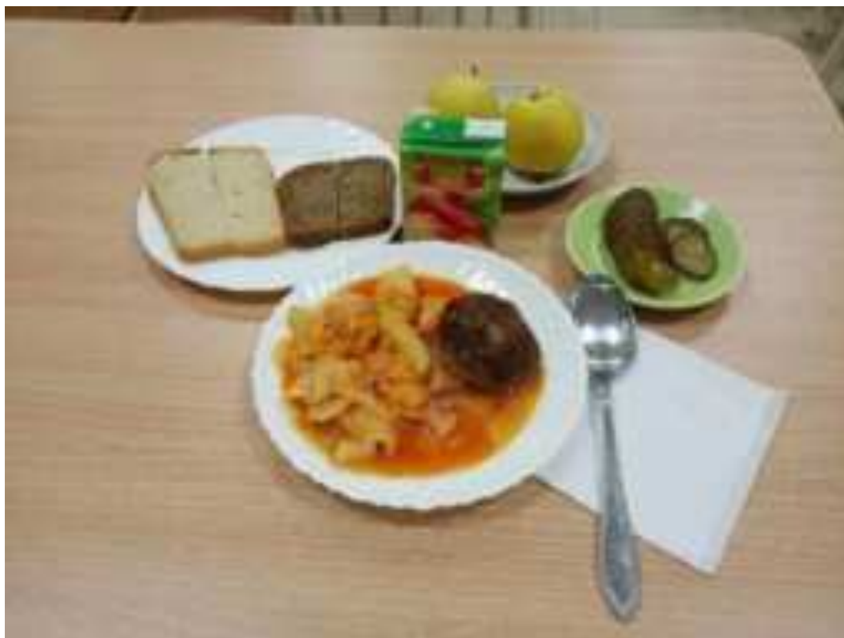
Рис. Рациональное питание в МАОУ СОШ №9 г. Армавира

Вода входит в состав всех органов и тканей человеческого тела. Она составляет главную массу крови, лимфы, пищеварительных соков. Для удовлетворения потребности в воде, в рацион ребенка нужно включать первые блюда, напитки (чай, молоко, кисель, компот, суп и т.п.), а также обеспечить доступ к чистой питьевой воде и соблюдать питьевой режим [11].