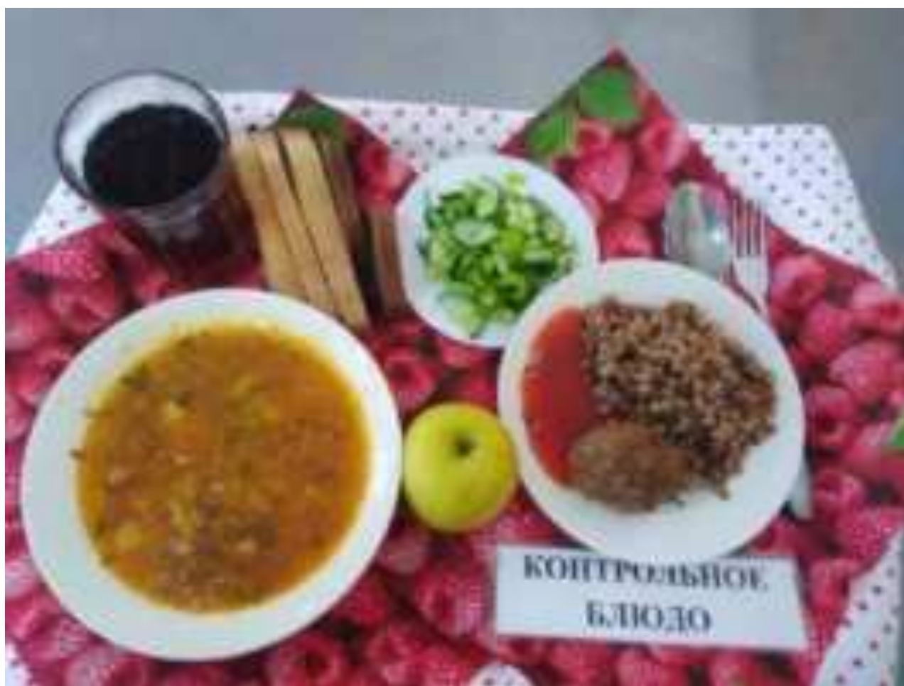
Рис. Обед в МБОУ СОШ №2 МО Тимашевский район