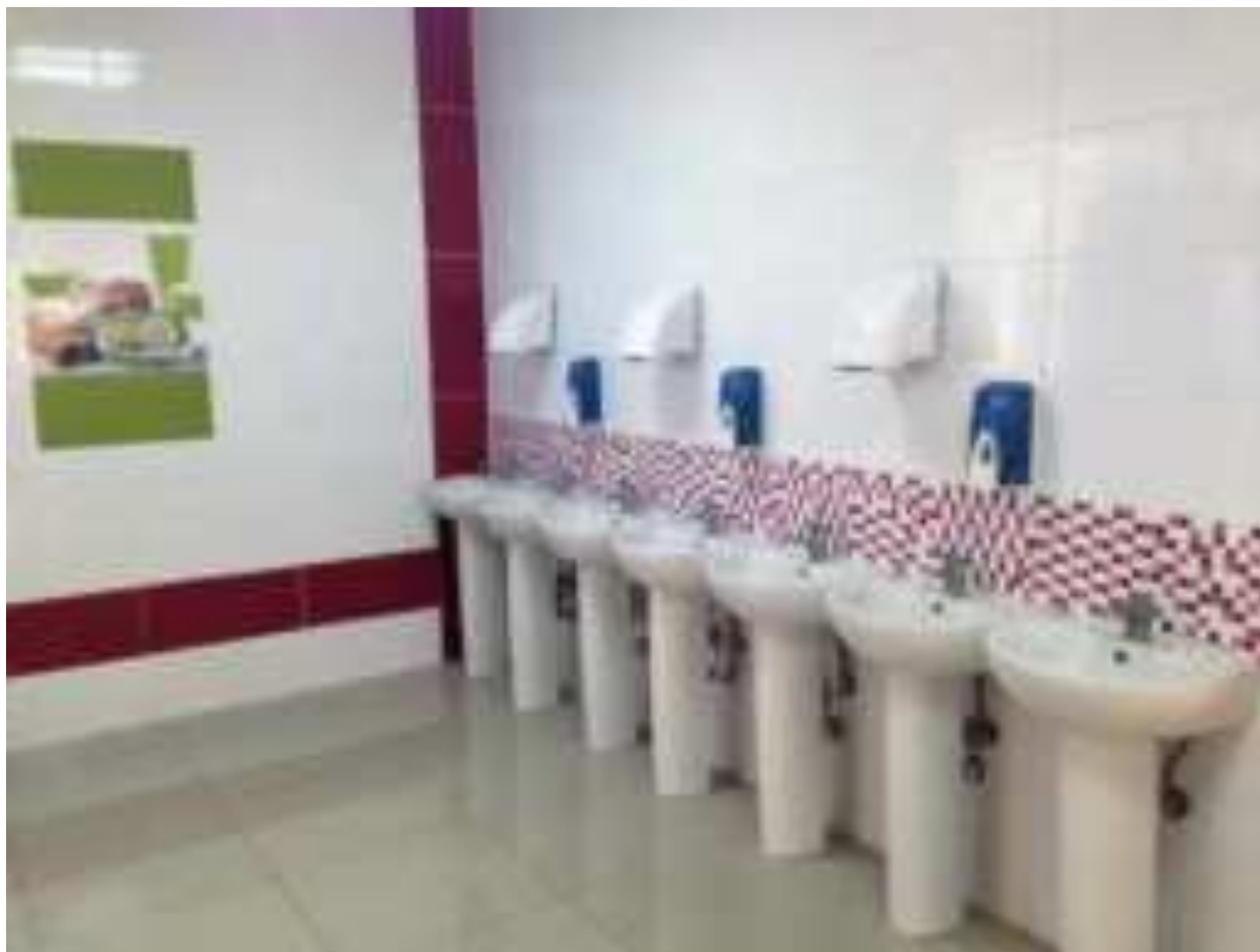
Рис. Организация пространства для гигиены рук в школе МО г. Сочи

Посещения общественных мест Занятий спортом Прикосновения к области инфекции кожи и кожных ран Посещения туалета Контакта с деньгами Работы за компьютером и другой оргтехникой Поездки в общественном транспорте И просто, если руки грязные или давно не мытые.