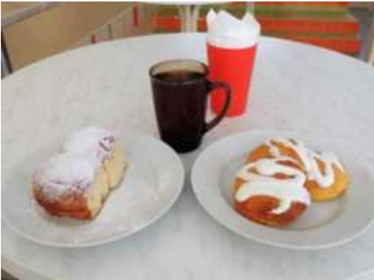
Рис. Творожные блюда в школьном питании МО Ейский район

Белки содержатся как в животных, так и растительных продуктах (крупы, муке, хлебе, картофеле). Наиболее полноценны белки животного происхождения , содержащиеся в мясе, рыбе, яйце, твороге, молоке, сыре, так как они содержат жизненно необходимые аминокислоты. Недостаток белка в питании ведет к задержке роста и развития ребенка, снижается сопротивляемость к различным внешним воздействиям.