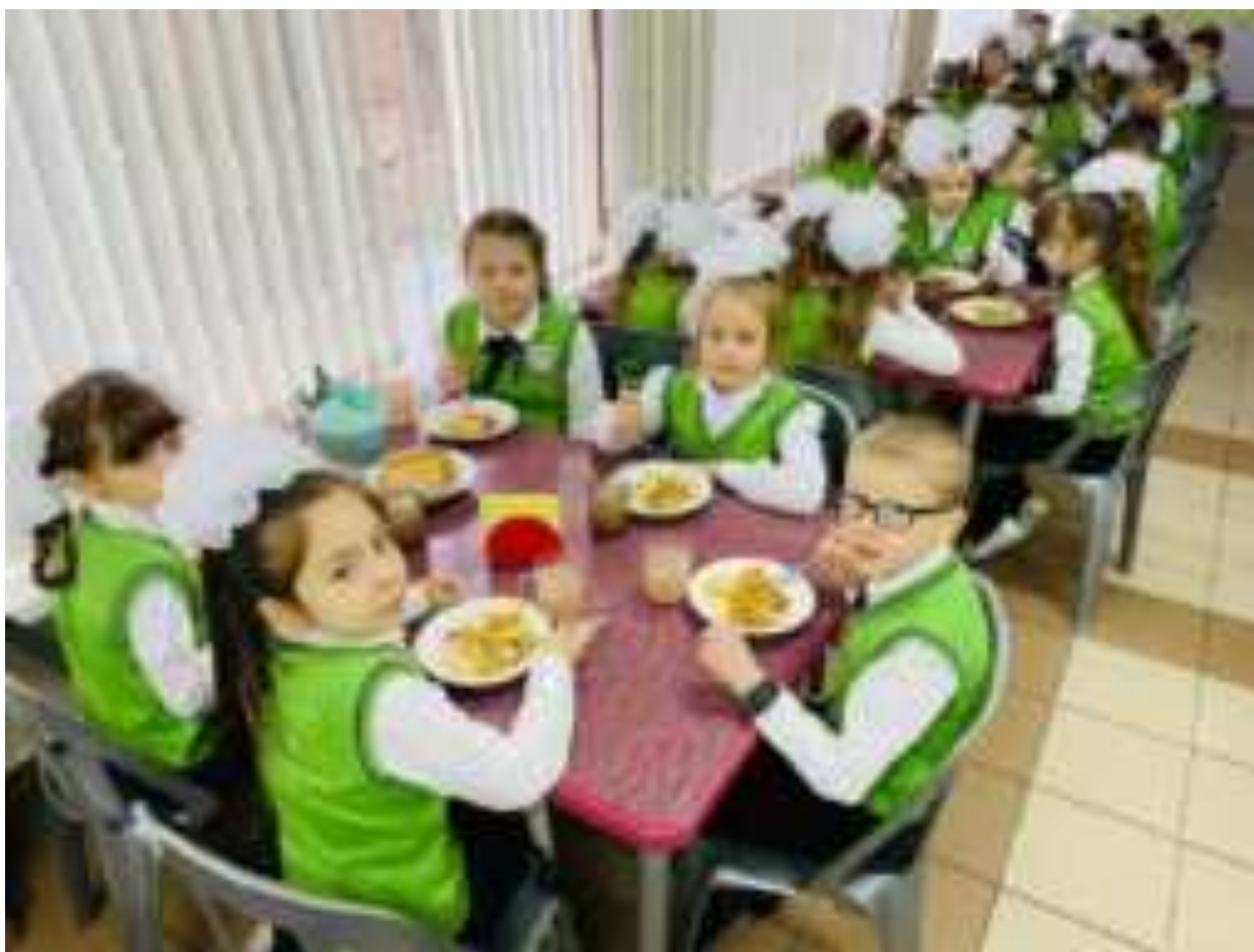
Рис. Организация школьного питания в МО Ленинградский район

Всерьёз взялся обучать русских дворян хорошим манерам только Пётр I. Он составил и издал знаменитую книгу «Юности честное зерцало», в которой были изложены правила поведения в обществе и подробно описаны правила поведения за столом.