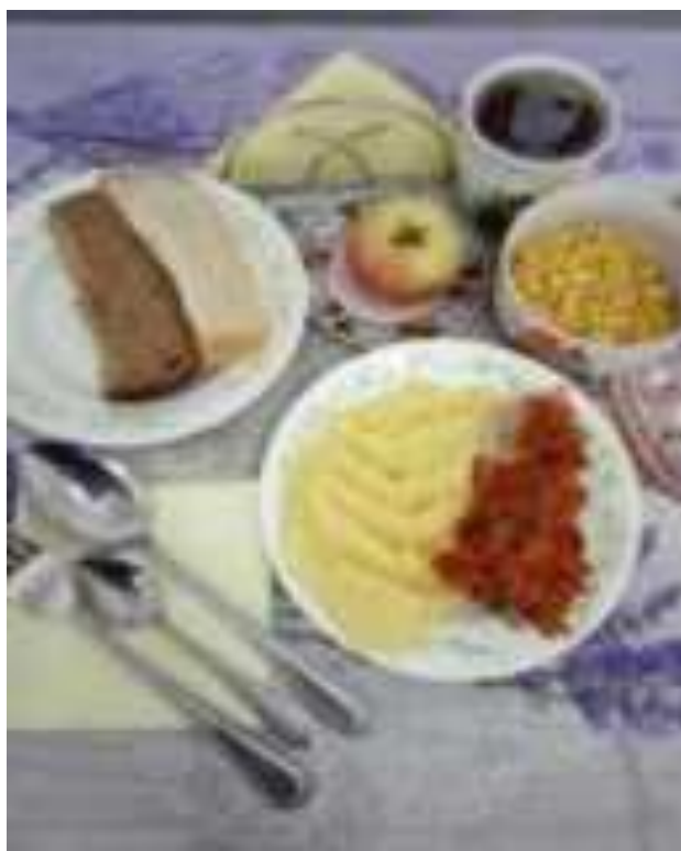
Рис. Вариант завтрака в школе МО Кореновский район