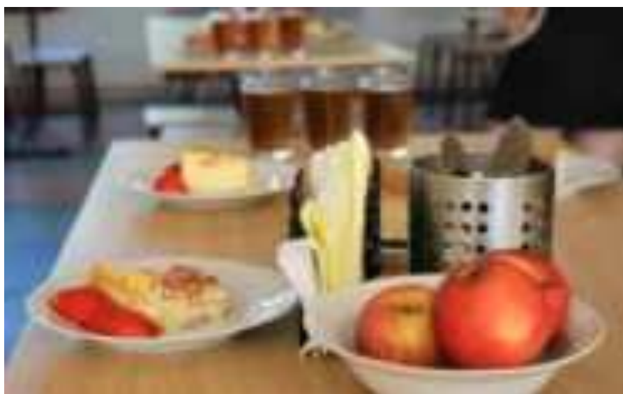
Рис. Завтрак в школе МО Тихорецкий район

Такая системная работа современной школы в области культуры здорового питания школьников возможна в рамках обновлённых школьных программ и планов воспитательной работы с учётом имеющихся эффективных практик взаимодействия с родительской общественностью и вовлечения самих школьников в творческую, проектно-исследовательскую, конкурсную деятельность по вопросам правильного питания и здорового образа жизни.