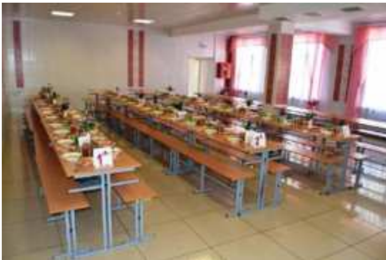
Рис. Обеденный зал МБОУ СОШ №43 МО Абинский район