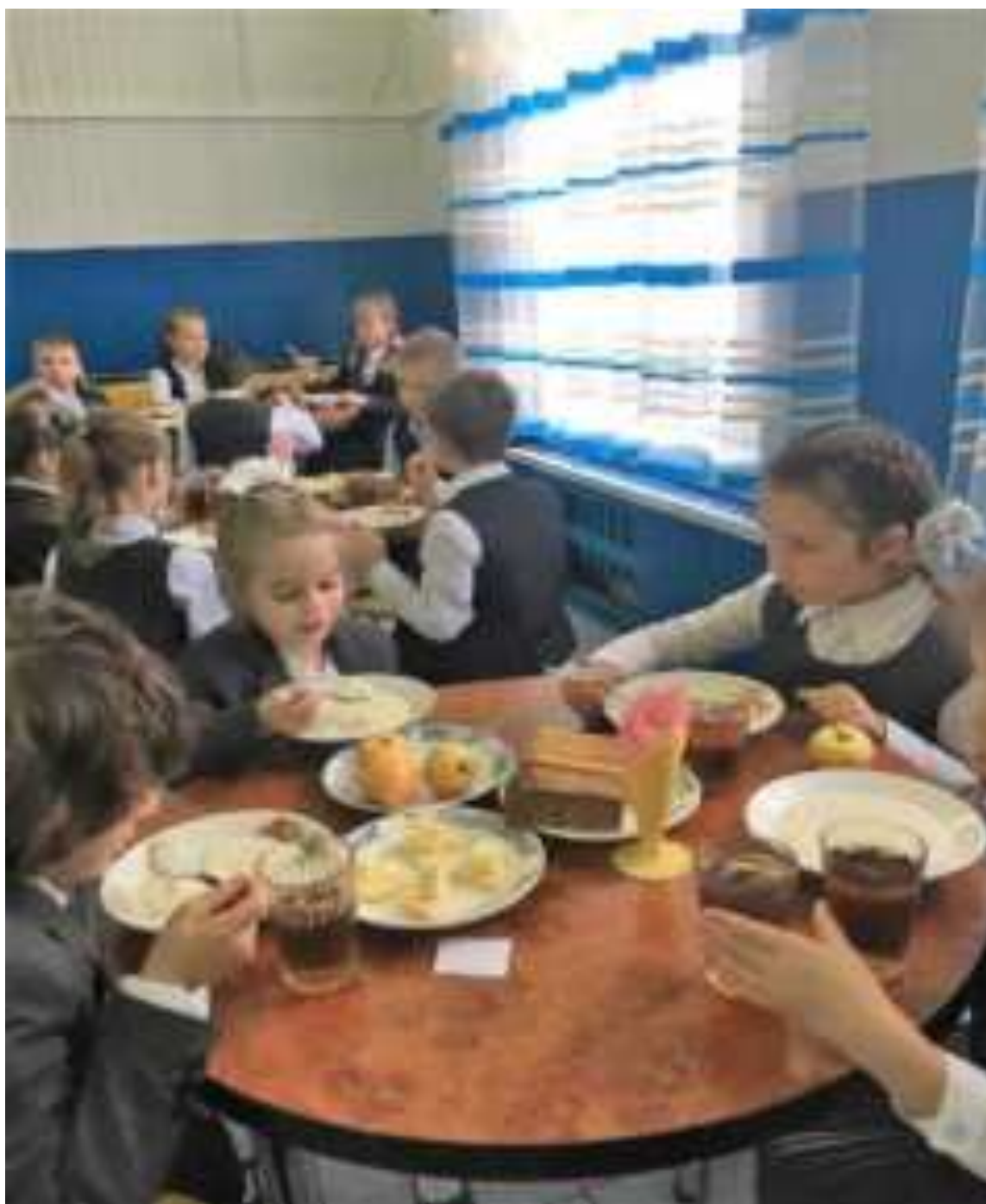
Рис. Каша на завтрак в МБОУ лицей №4 имени кавалера ордена Красной Звезды Сергея Николаевича Малика и кавалера ордена Мужества Андрея Николаевича Ливеровского г. Славянска-на-Кубани МО Славянский район

Основой геркулеса является семена овса, которые обработаны таким способом, что лишены твердой, жесткой не перевариваемой оболочки, превращенные именно в хлопья. Но все же в процессе изготовления производителям до конца не удастся очистить их от остатков этой оболочки, тем самым мы из этого процесса извлекаем пользу. Оставшиеся не удалённые частицы проходя по кишечнику и очищают его стенки и уносят с собой вредные шлаки.