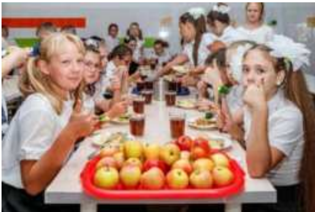
Рис. Организация питания в МБОУ МО г. Краснодар СОШ №37 имени Героя Советского Союза Алексея Леженина

граждан к здоровому образу жизни, включая здоровое питание и отказ от вредных привычек», а также содержание нормативных документов и изданий по теме здорового питания школьников.