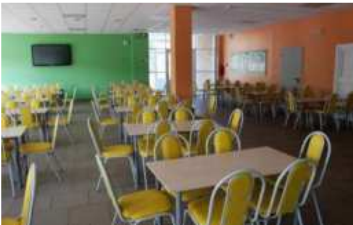
Рис. Школьная столовая МО Каневской район

Так, Новосибирский научно-исследовательский институт гигиены Роспотребнадзора предлагает дистанционное обучение для дошкольников и школьников (детей, педагогов, родителей) по санитарно-просветительским программам «Основы здорового питания». Обучаясь дистанционно по данной программе, можно научиться составлять режим дня с построением требуемых характеристик питания, соответствующих фактическим энерготратам конкретного ребенка; сформировать меню на один день с учетом возраста, состояния здоровья (сахарный диабет, целиакия, пищевая аллергия), рекомендуемого распределения суточной калорийности по приемам пищи, обеспечения рекомендуемых величин энергетической ценности каждого приема пищи, их пищевой и биологической ценности; воспользоваться сборниками рецептов, в которых сконцентрированы технологические карты, соответствующие возрасту ребенка и принципам здорового питания, разработанные экспертами института гигиены (ссылка на сайт программы https://edu.demography.site/ ).