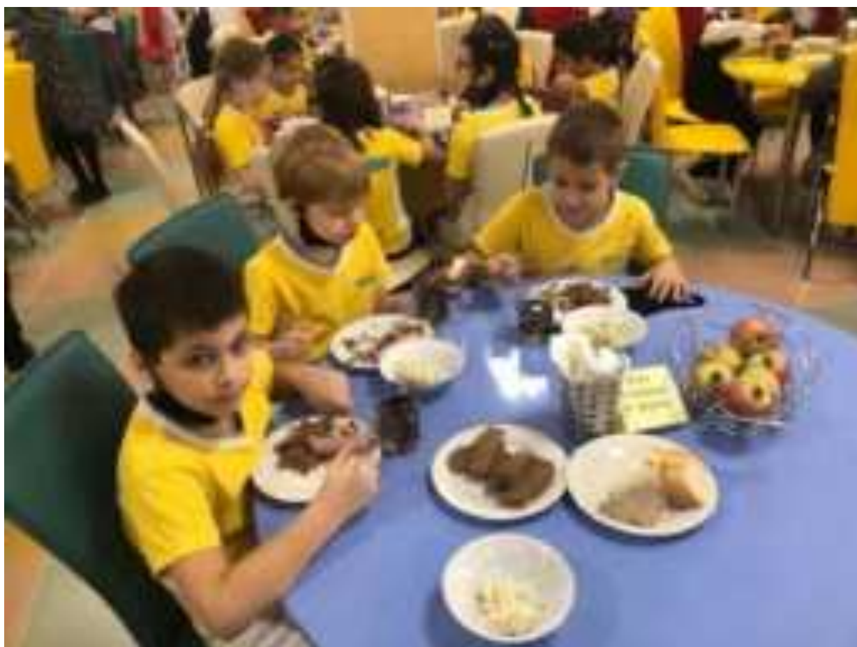
Рис. Прием пищи в МАОУ МО г. Краснодар гимназия № 92 имени Героя РФ Александра Аверкиева