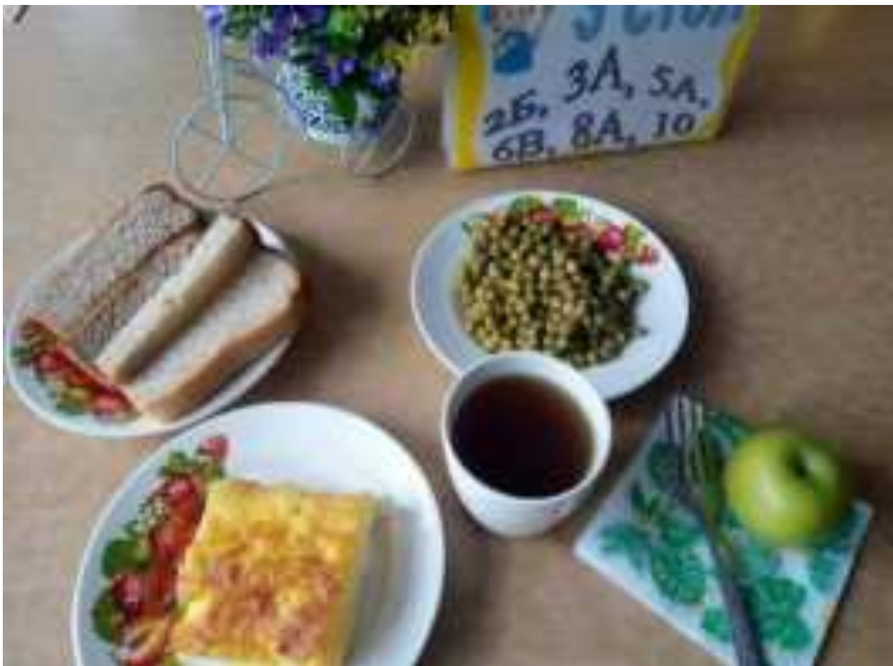
Рис. Вариант школьного завтрака. МО Курганинский район

* - рекомендуется готовить без добавления сахара, при подаче сахар можно подавать порционно (фасованный).