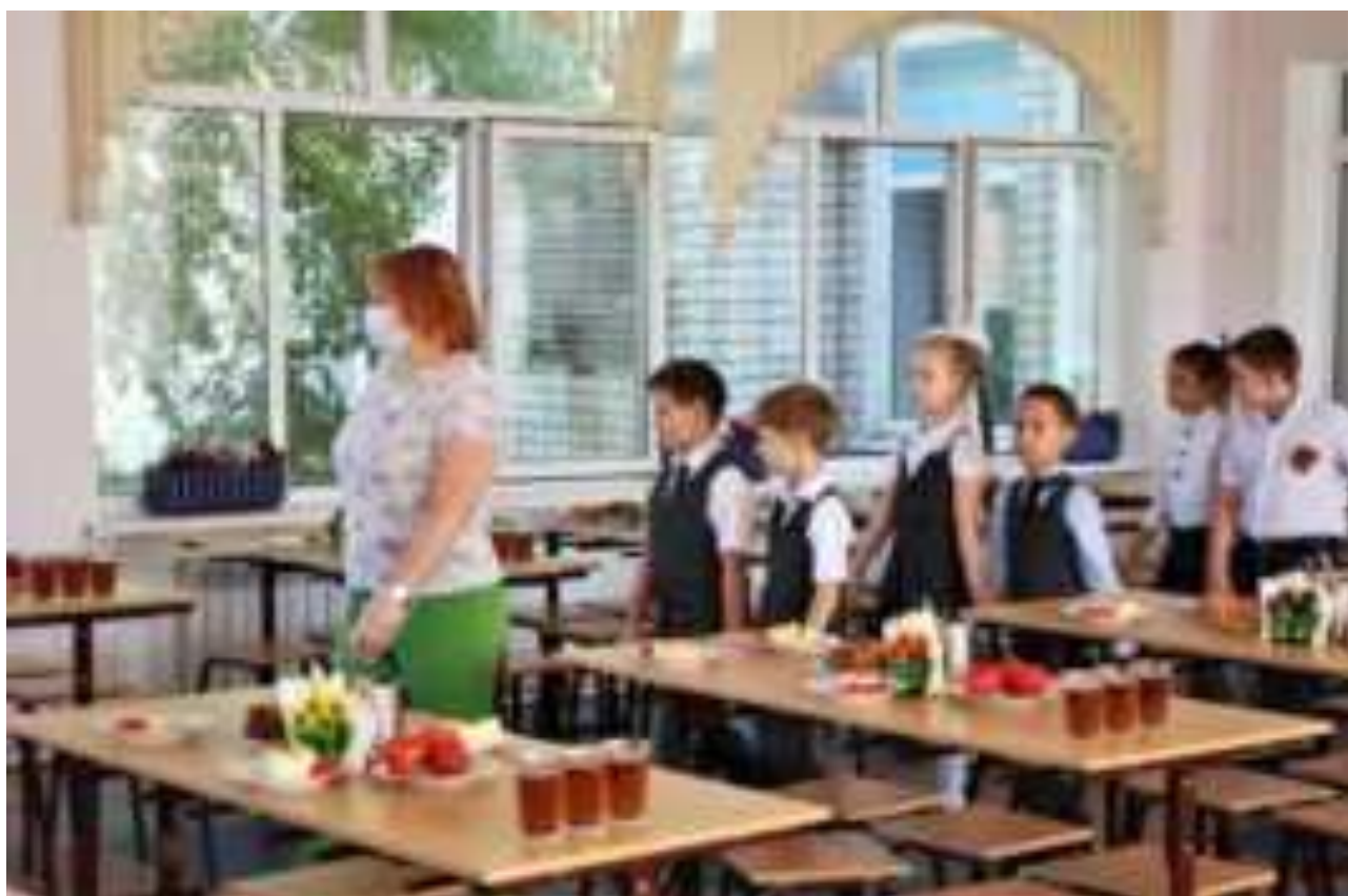
Рис. Дети идут на завтрак в школе МО Тихорецкий район

Специалистами Роспотребнадзора были разработаны и утверждены рекомендации (МР) по организации питания обучающихся общеобразовательных организаций, которые определяют основные положения организации здорового питания школьников, в том числе горячего питания школьников 1 -4 классов [15, 16]. В МР реализованы принципы здорового питания , включающие уменьшение количества потребляемых кондитерских изделий, колбасных изделий, сахара и соли ; предложены варианты базового меню для разработки региональных типовых меню, учитывающих территориальные, национальные и другие особенности питания населения. В разделах о горячем питании и примерном меню, а также в рекомендациях родителям по питанию детей школьного возраста широко использована нормативная информация из этих источников.