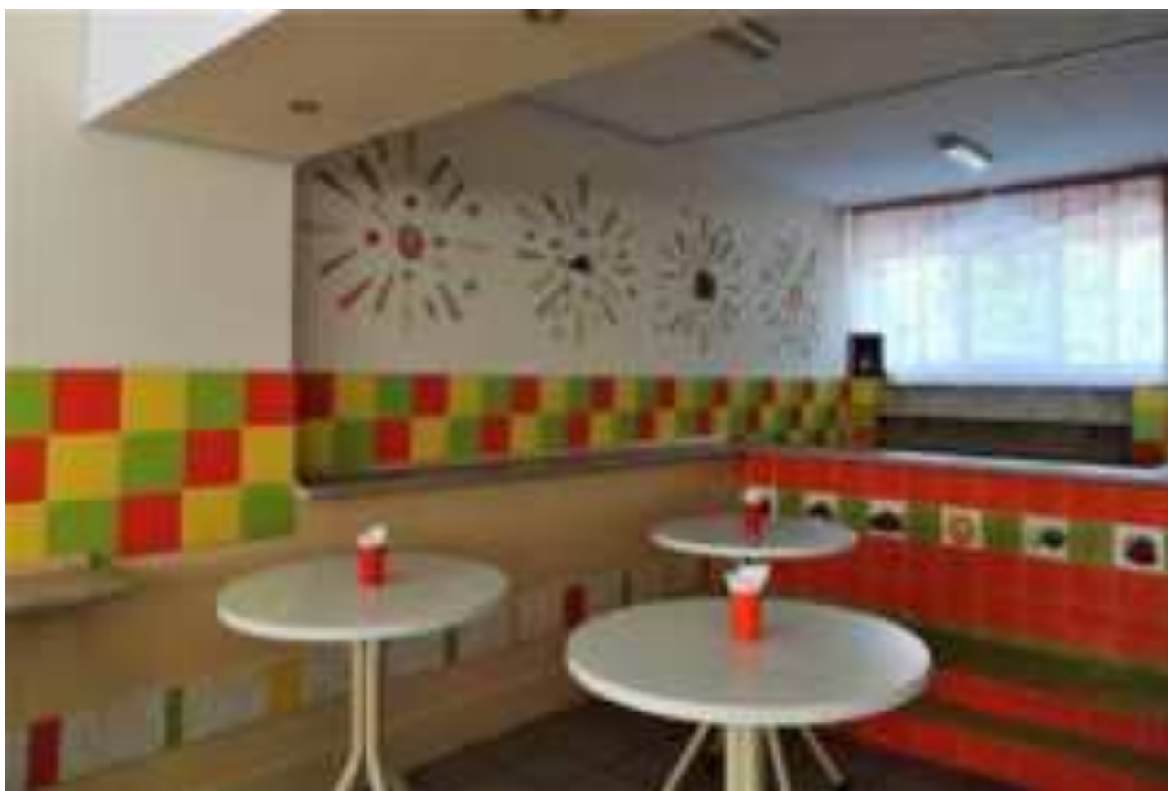
Рис. Оформление буфетной зоны в школе МО Ейский район

В настоящее время в состоянии здоровья школьников преобладает увеличение удельного веса имеющих хроническую патологию и уменьшение числа относительно здоровых детей. К сожалению, в структуре заболеваний школьников стали чаще встречаться заболевания ЖКТ, почек, болезни обмена веществ, да и близорукость и сколиоз стали частыми спутниками наших детей. Не рационально построенные нагрузки, не сбалансированное питание могут привести к ухудшению здоровья и обострениям уже имеющихся хронических заболеваний.