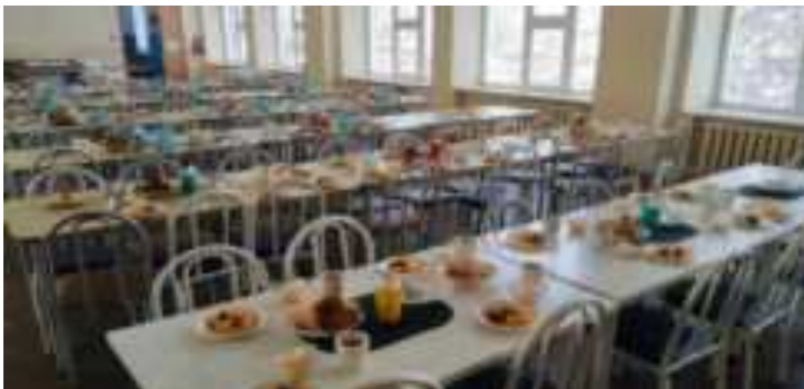
Рис. Организация школьного питания в МО Белореченский район

Такая системная работа современной школы в области культуры здорового питания школьников возможна в рамках обновлённых школьных программ и планов воспитательной работы с учётом имеющихся эффективных практик взаимодействия с родительской общественностью и вовлечения самих школьников в творческую, проектно-исследовательскую, конкурсную деятельность по вопросам правильного питания и здорового образа жизни.