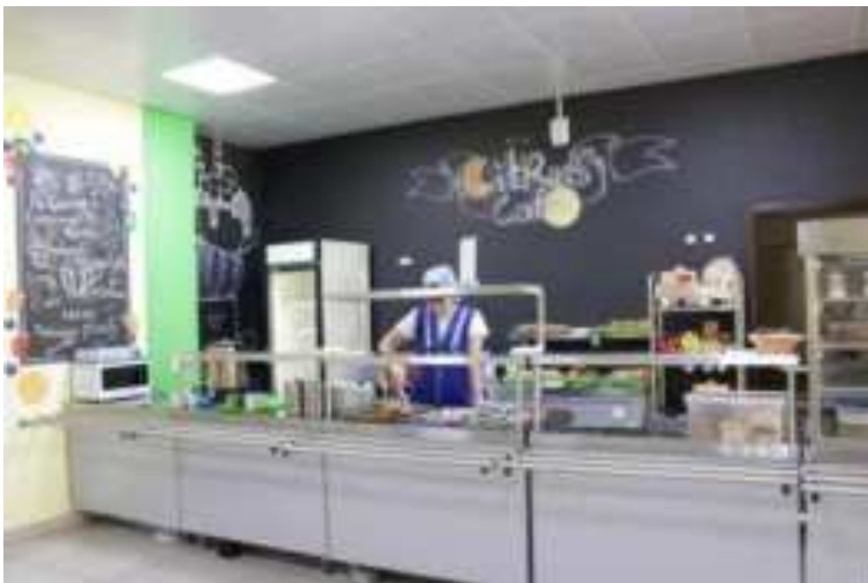
Рис. Оформление школьной столовой МО г. Новороссийска

Известно, что отрицательно влияют на здоровье ребенка как недостаточное, так и избыточное питание . При недостаточном питании отмечаются плохая прибавка массы тела, ухудшение физического развития ребенка, снижение иммунологической защиты. При избыточном питании наблюдается излишняя прибавка в весе, развитие тучности и ожирения.