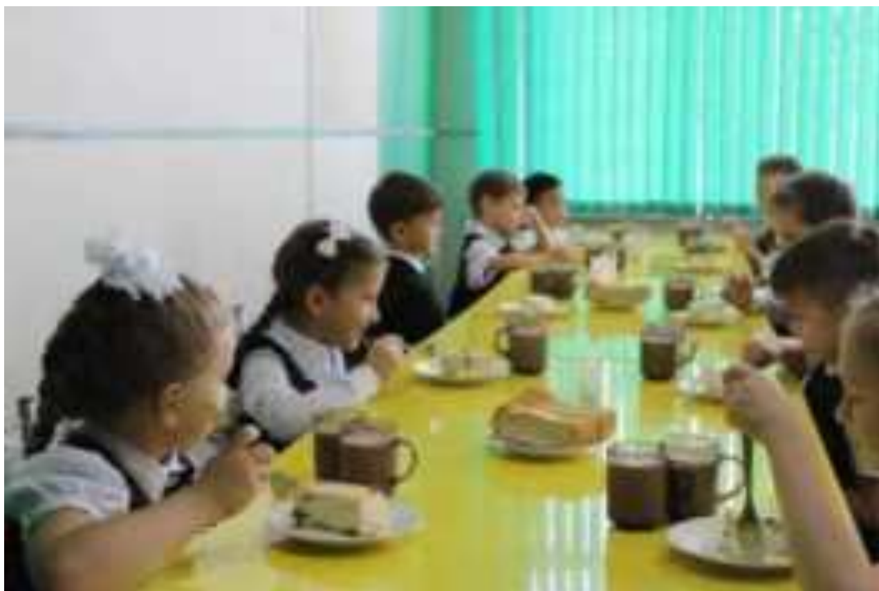
Рис. Блюда из молока и творога в школьном питании МО Белоглинский район

Молочные продукты - крайне важные элементы питания школьника, благотворно влияющие на иммунитет. Дело в том, что иммунные клетки организма - это белковые молекулы, следовательно, для того чтобы обеспечить надежный заслон от вирусов и бактерий, организму требуются протеины. Белки, содержащиеся в молочных продуктах, можно считать наиболее полноценными с этой точки зрения. Организм усваивает их на 95%, и они содержат все незаменимые аминокислоты. Кроме того, в них содержатся легкоусвояемые микроэлементы, аминокислоты, кальций, фосфор, а кисломолочные продукты являются источником необходимых для пищеварения бактерий.