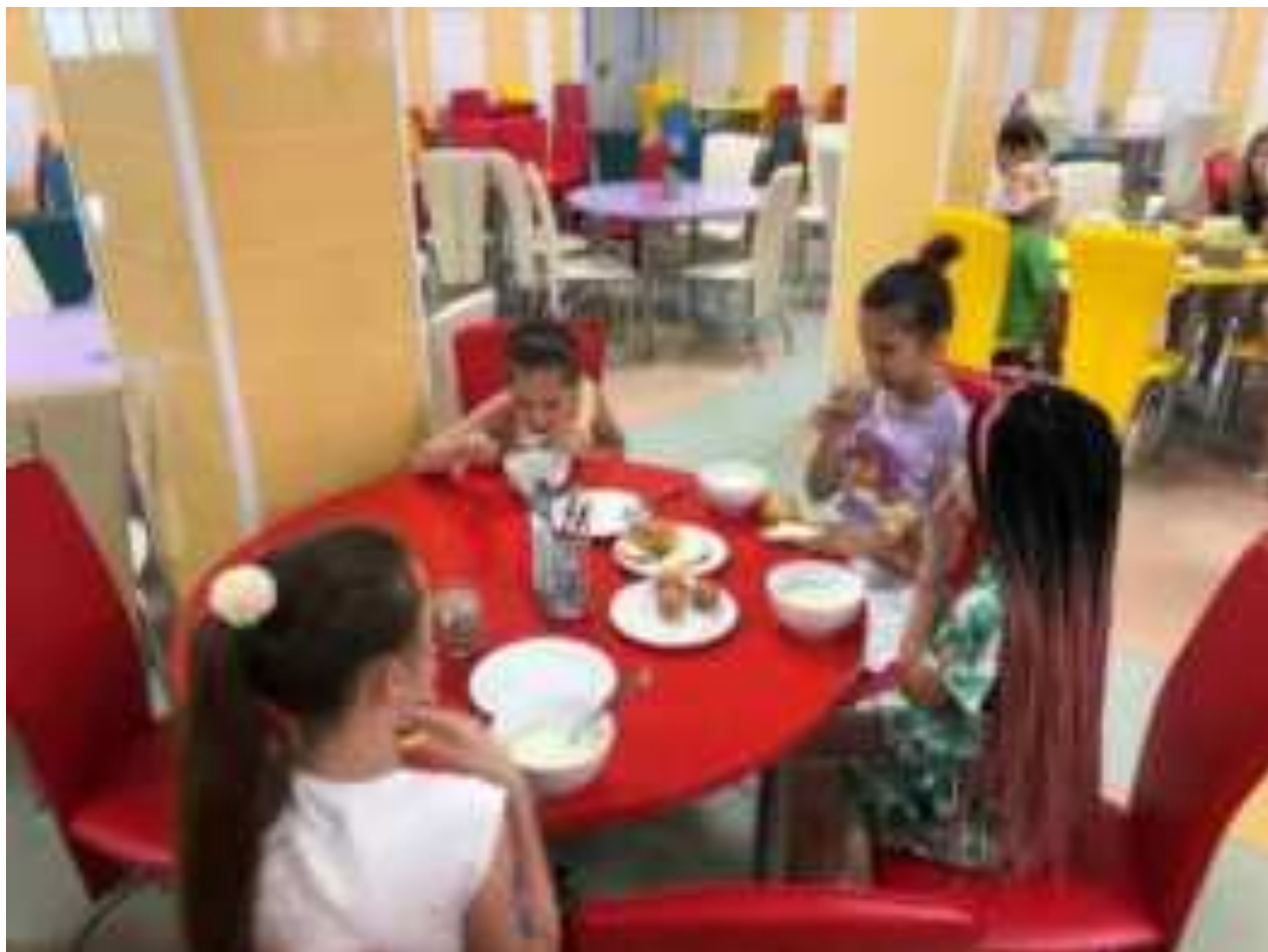
Рис. Питание в школьном летнем лагере в МАОУ МО г. Краснодар гимназия №92 имени Героя РФ Александра Аверкиева

15. Не предлагайте детям еду, если они находятся в состоянии сильного эмоционального переживания, а также когда ребенок устал, когда он замерз или перегрелся, полон страха или гнева, при лихорадке, болях.