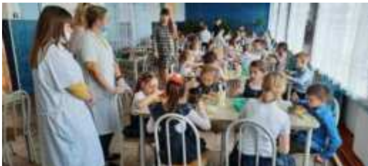
Рис. Организация родительского контроля над организацией питания в школах в МО Кореновский район