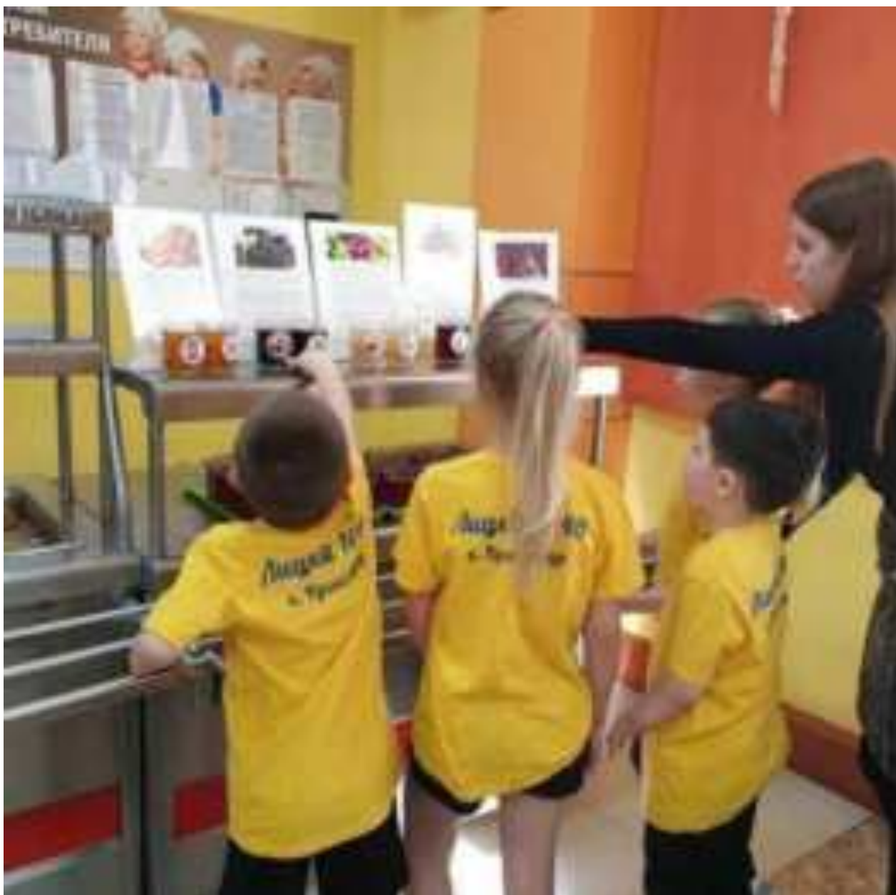
Рис. Просветительская работа в МАОУ Лицее №48 МО г. Краснодар имени А.В. Суворова

Обучение будет осмысленным, если оно привязано к жизни, поэтому родители являются активными участниками образовательных проектов о здоровом питании. Вместе с детьми родители учатся выбирать продукты, необходимые для сбалансированного питания, и осознанно формировать семейный рацион. В проектах «Разговор о правильном питании» и «Здоровое питание от А до Я» проводится много интересных конкурсов для детей, родителей и учителей.