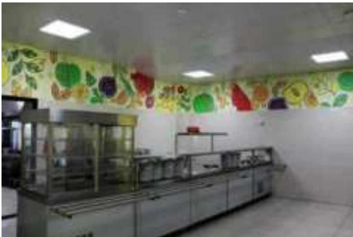
Рис. Оформление школьной столовой МО г. Новороссийска