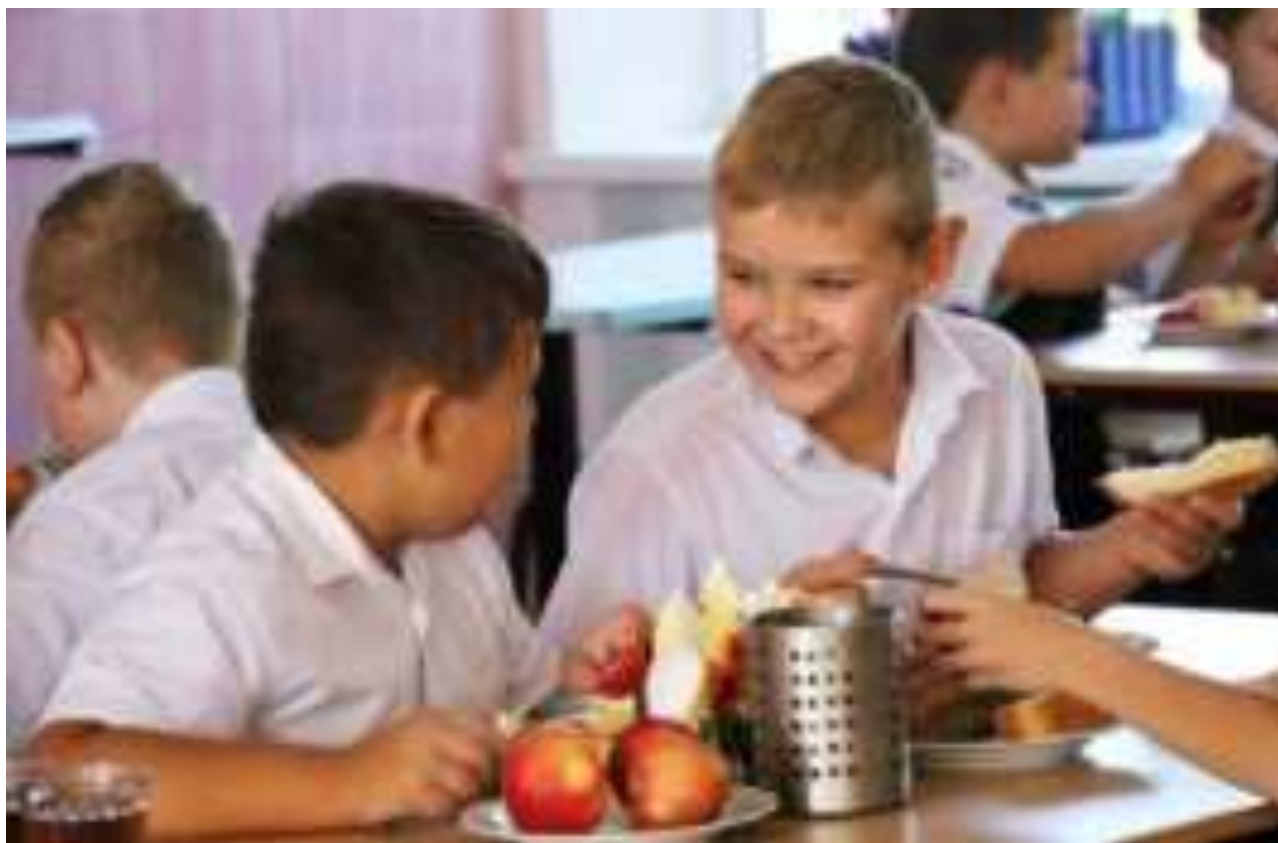
Рис. Школьный завтрак МО Тихорецкий район

Задачу обеспечить бесплатным горячим питанием всех учащихся начальной школы с первого по четвертый класс обозначил Президент Российской Федерации Владимир Путин 15 января 2021 года в своем Послании Федеральному Собранию.