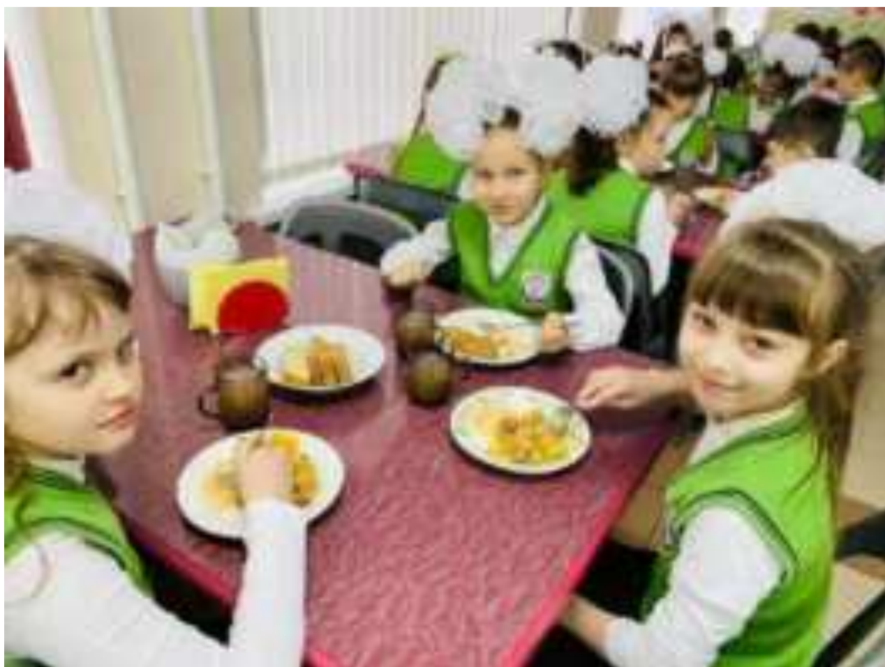
Рис. Питание младших школьников в МО Ленинградский район

Учащиеся начальных классов обеспечиваются бесплатным горячим питанием в зависимости от режима обучения.